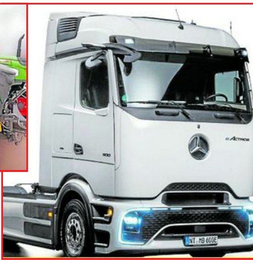
Sternpartner bringt ihn zur Messe mit: den elektrischen Actros (eActros 600) von Mercedes-Benz Trucks. Die 600 kWh-Lithium-Eisenphosphat-Batterie ermöglicht bis zu 500 Kilometer Reichweite.