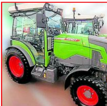
Technisch ist es möglich, emissionsfrei durch die Obstplantagen zu fahren. Fendt zeigt das dafür passende Arbeitsgerät, den vollelektrischen Traktor e100 Vario.