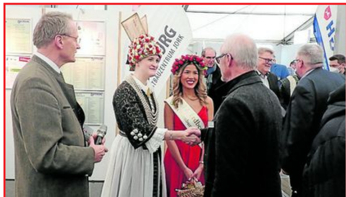
Die Norddeutschen Obstbautage stehen für neueste Informationen und Begegnungen. Auch die Altländer Blütenkönigin und weitere Hoheiten besuchen die Fachmesse, die sich allen Interessierten öffnet.